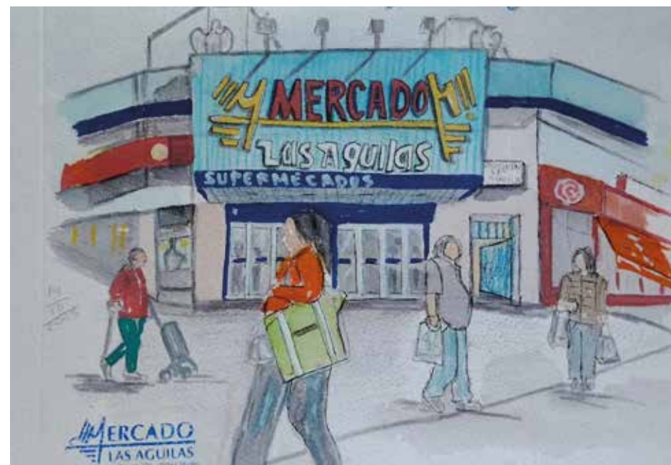
Isabel Moreno Cano