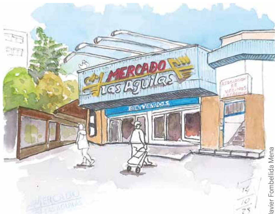
Javier Fombellida Mena